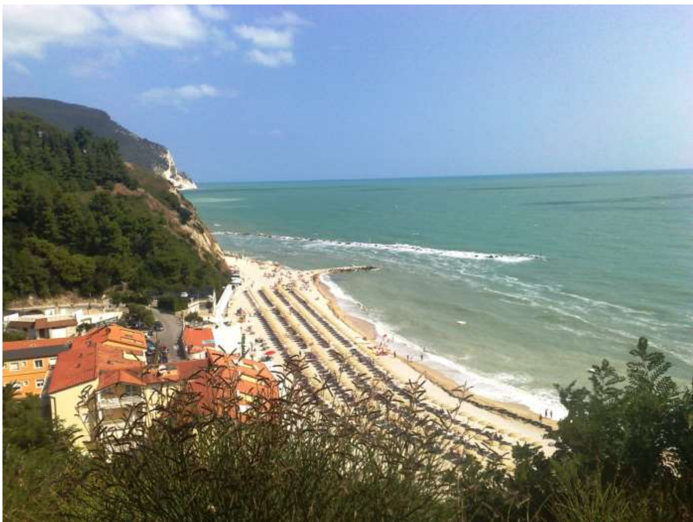
Giovedì 22 agosto Numana una delle sue spiagge .