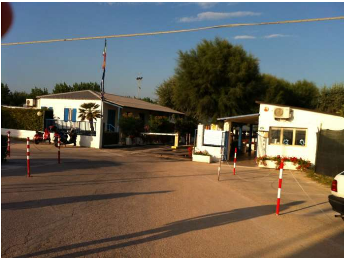
Domenica 18 agosto Porto Recanati ingresso del camping "La medusa"