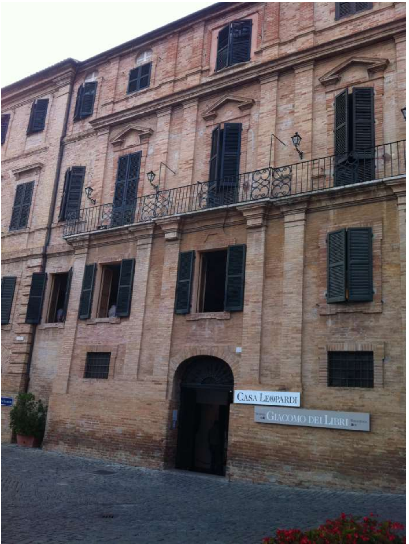
Venerdì 23 agosto 2013 Recanati ..... casa natale del poeta Giacomo Leopardi.