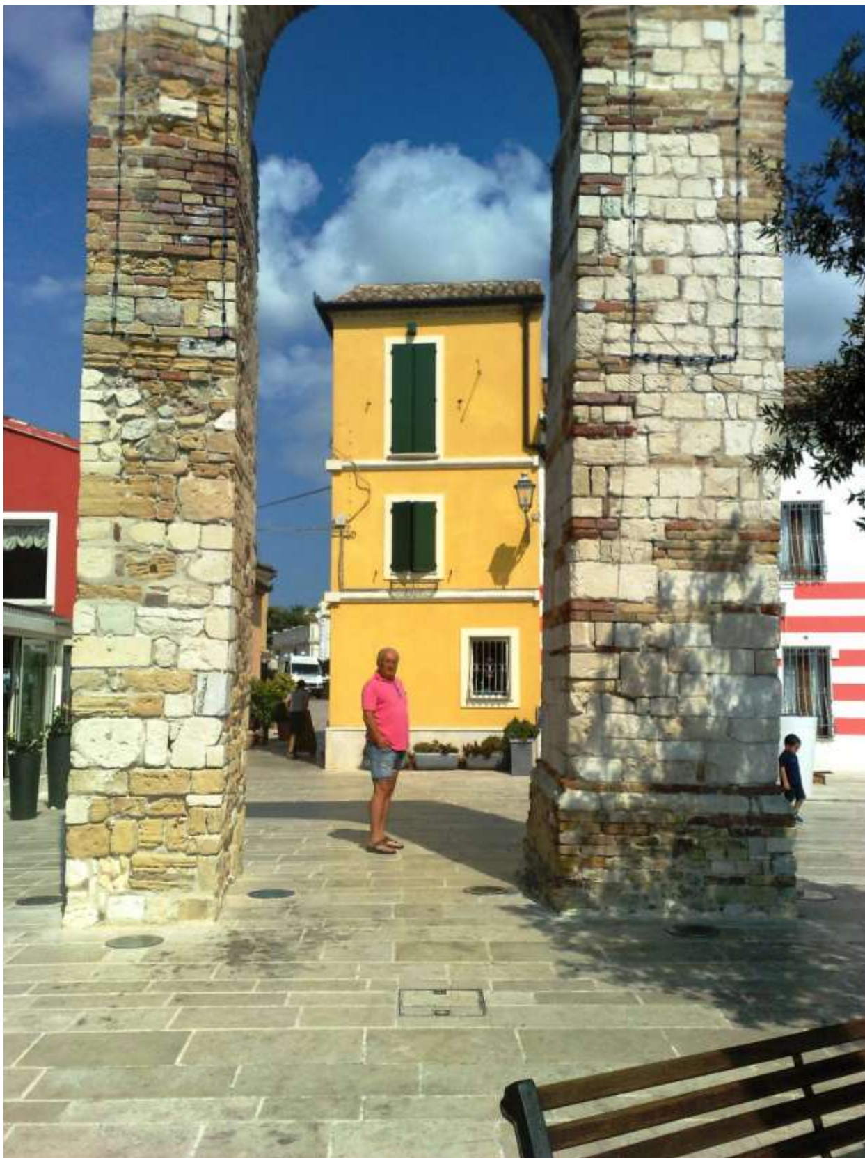
Giovedì 22 agosto Numana. Resti dell'arco della Torre romana.