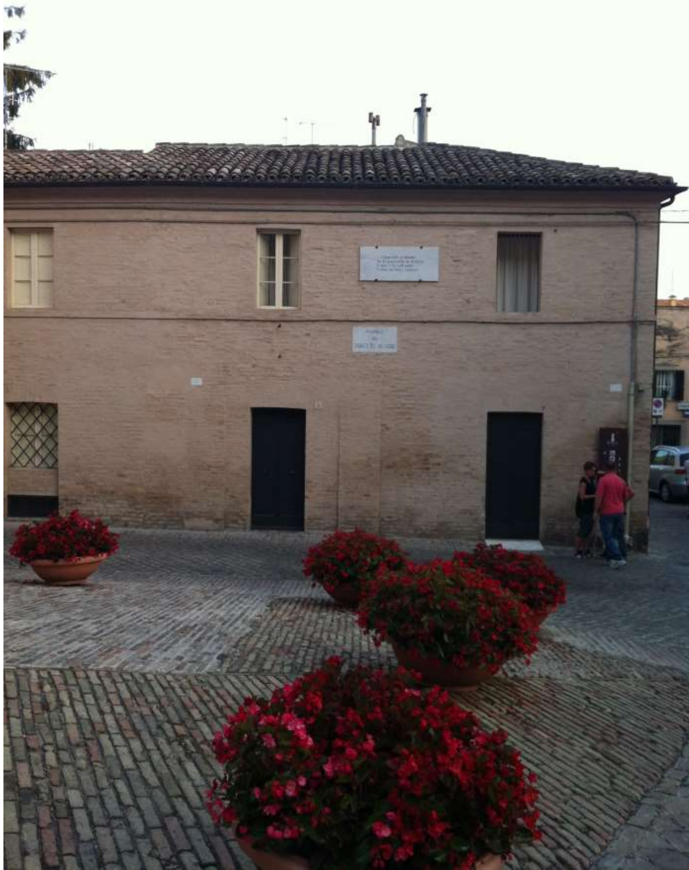
Venerdì 23 agosto 2013 Recanati ..... la piazzetta che ispirò "il sabato del villaggio".