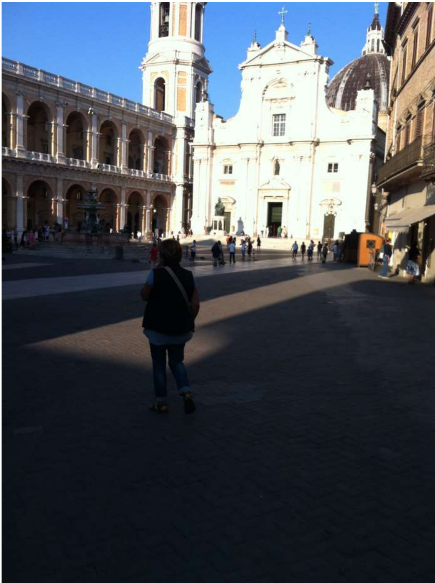
Martedì 20 agosto 2013 in visita alla città di Loreto ..... la basilica