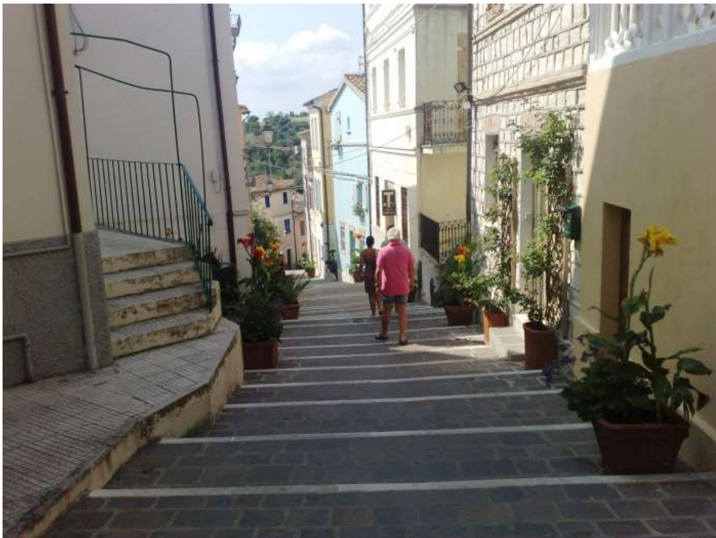
Giovedì 22 agosto Numana . Scalinata che dal basso porta al centro storico.