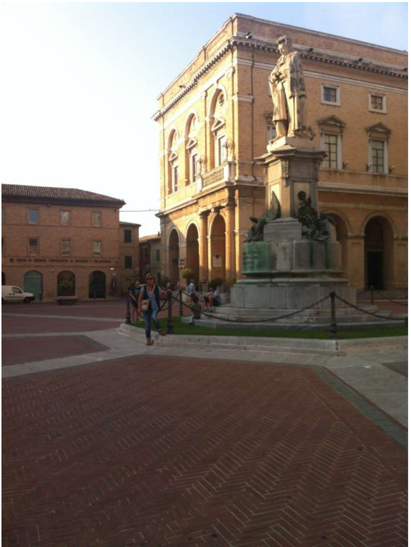
Venerdì 23 agosto 2013 Recanati ..... monumento al suo poeta Giacomo Leopardi.