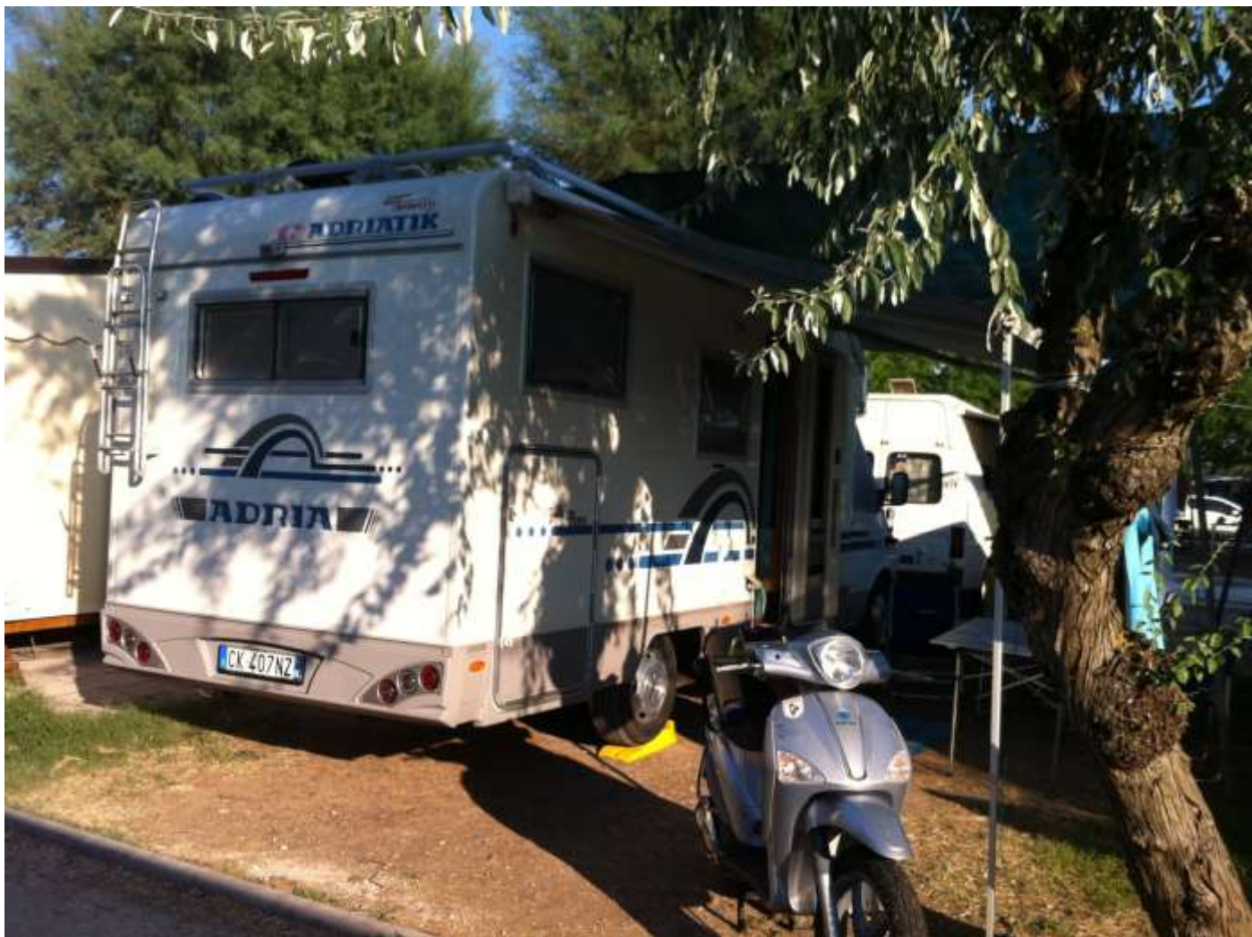
Domenica 18 agosto Porto Recanati sistemazione nel camping "La medusa"