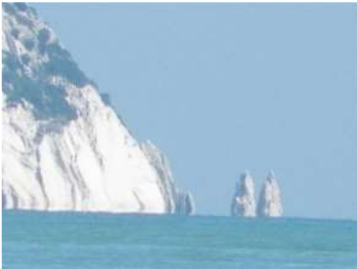
In barca verso la spiaggia "le due sorelle"