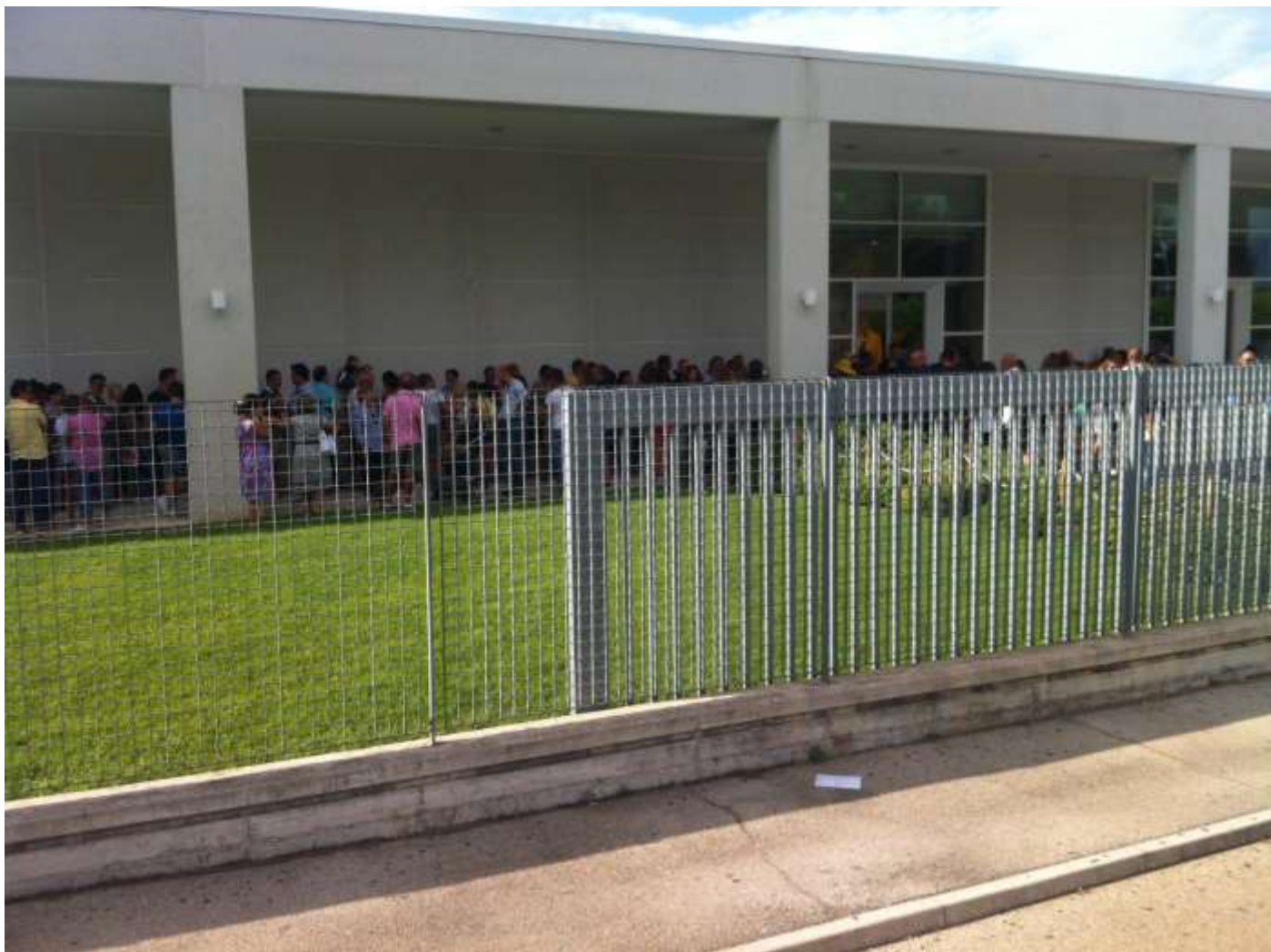
Mercoledì 21 agosto Casette D'ete Coda interminabile all'ingresso dello spaccio della Tods.