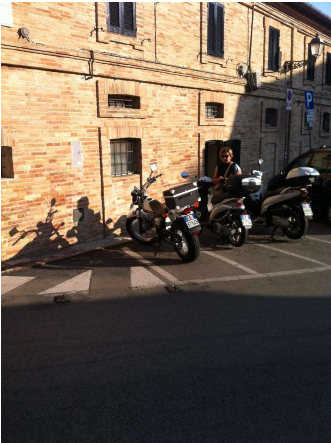
Martedì 20 agosto 2013 in visita alla città di Loreto